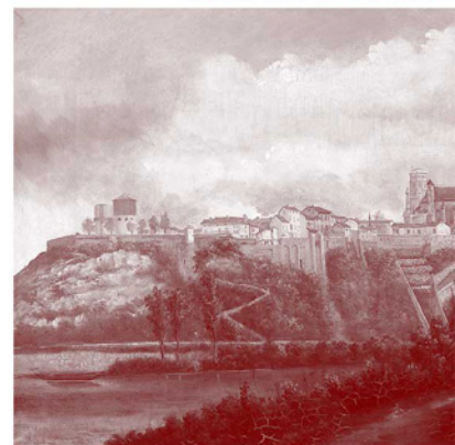
Vue de Lavaur depuis La Bastide Saint-Georges par Bénézet, 1890