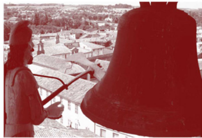
Jacquemart III, en place depuis 1922