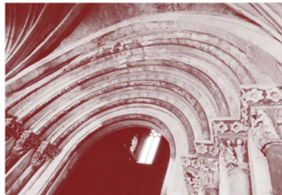
Portail sud, entrée primitive